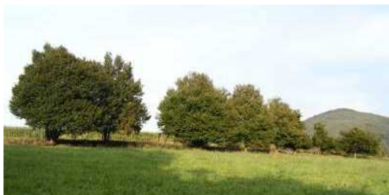
Érables alignés dans un champ entre Chein-Dessus et Arbas : vestiges du mode de culture de la vigne sur hautins, comme en subsistent encore quelques exemples à Saleich