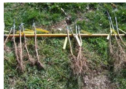
Cerisiers fraîchement greffés sur Ste Lucie