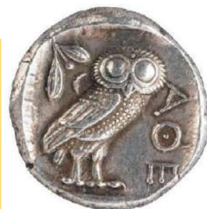
ancienne monnaie ou euro actuel en Grèce

Les Romains l'associent à la mort : voir une chouette de jour ou l'entendre chanter annonce un décès proche. Au Moyen Âge, on l'associe aux sorcières et à l'hérésie, on la cloue sur la porte des granges pour se protéger des orages et conjurer le mauvais sort. Cette funeste coutume a perduré bien au-delà, avec toutes les espèces de chouettes et hibous.