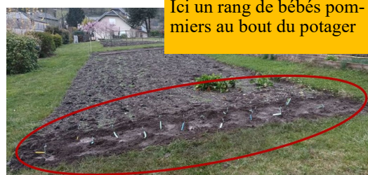
Ici un rang de bébés pommiers au bout du potager

greffeurs motivés le 14 mars. Les petits scions sont répartis chez 12 bénévoles un eu partout dans le Comminges.